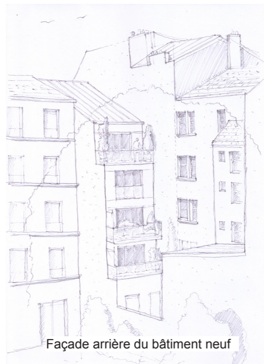
Façade arrière du bâtiment neuf