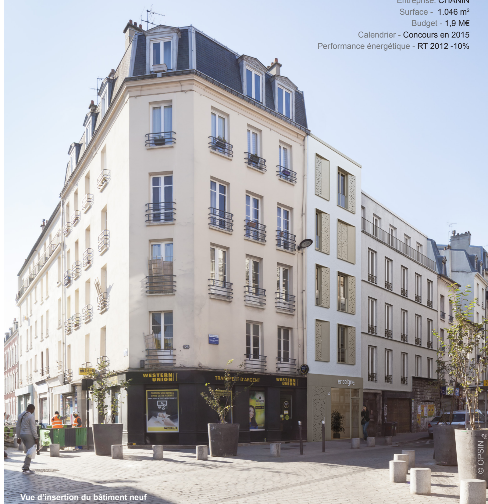
Vue d'insertion du bâtiment neuf