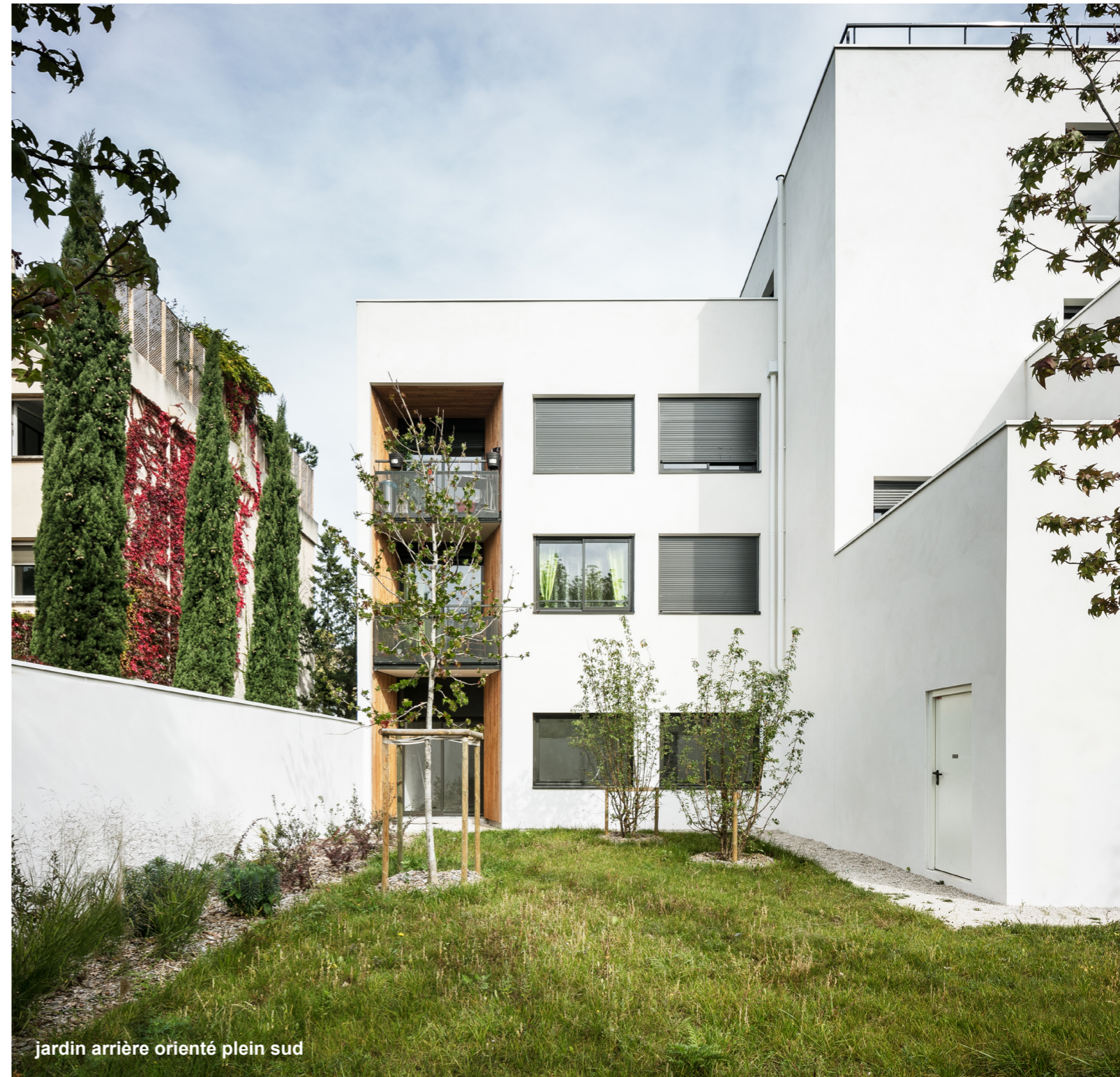
jardin arriere orienté plein sud