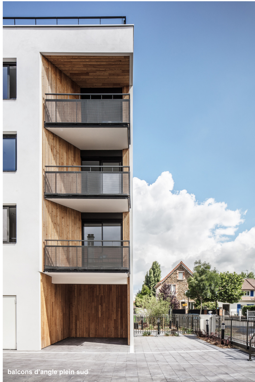
balcons d'angle plein sud