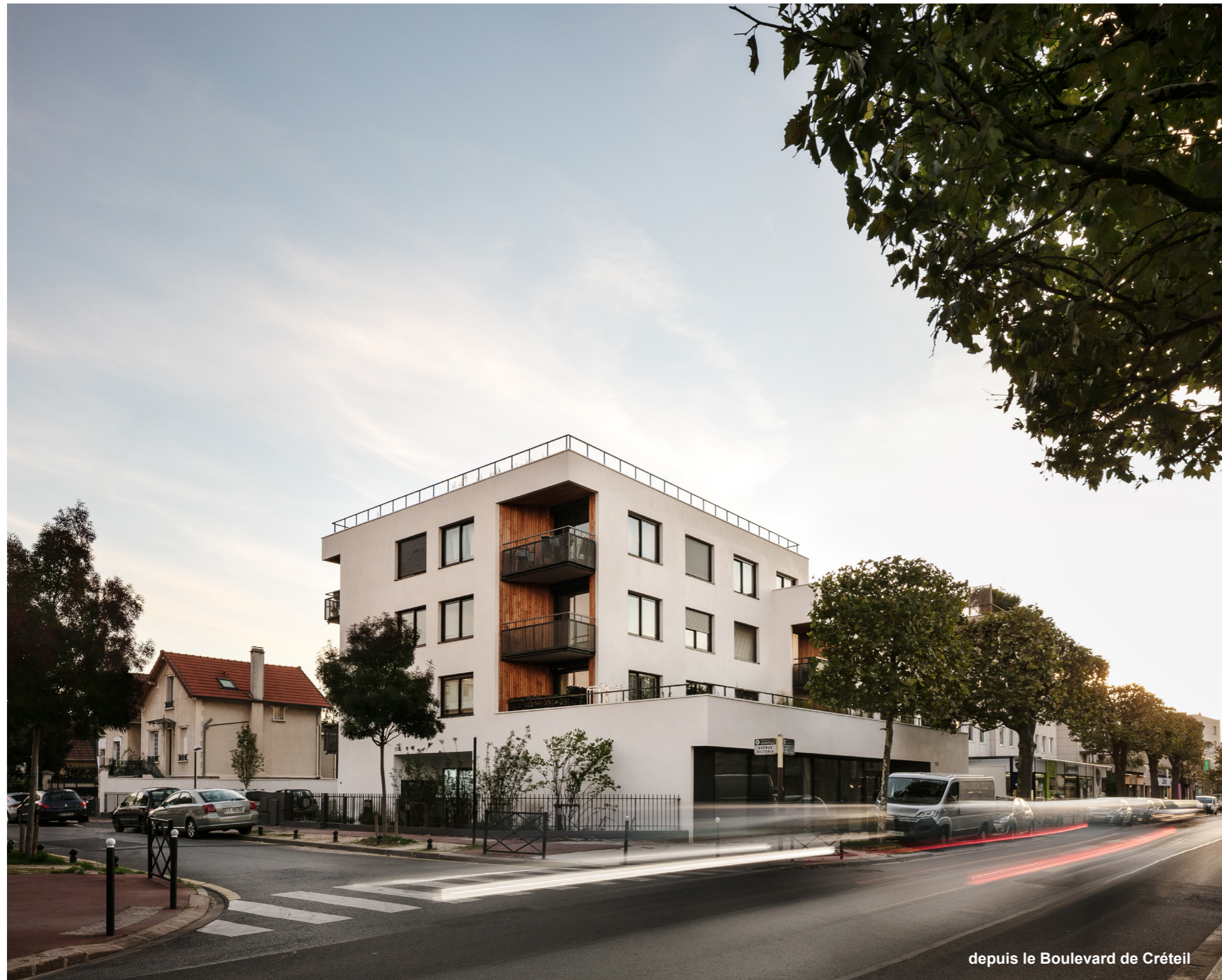
depuis le Boulevard de Créteil