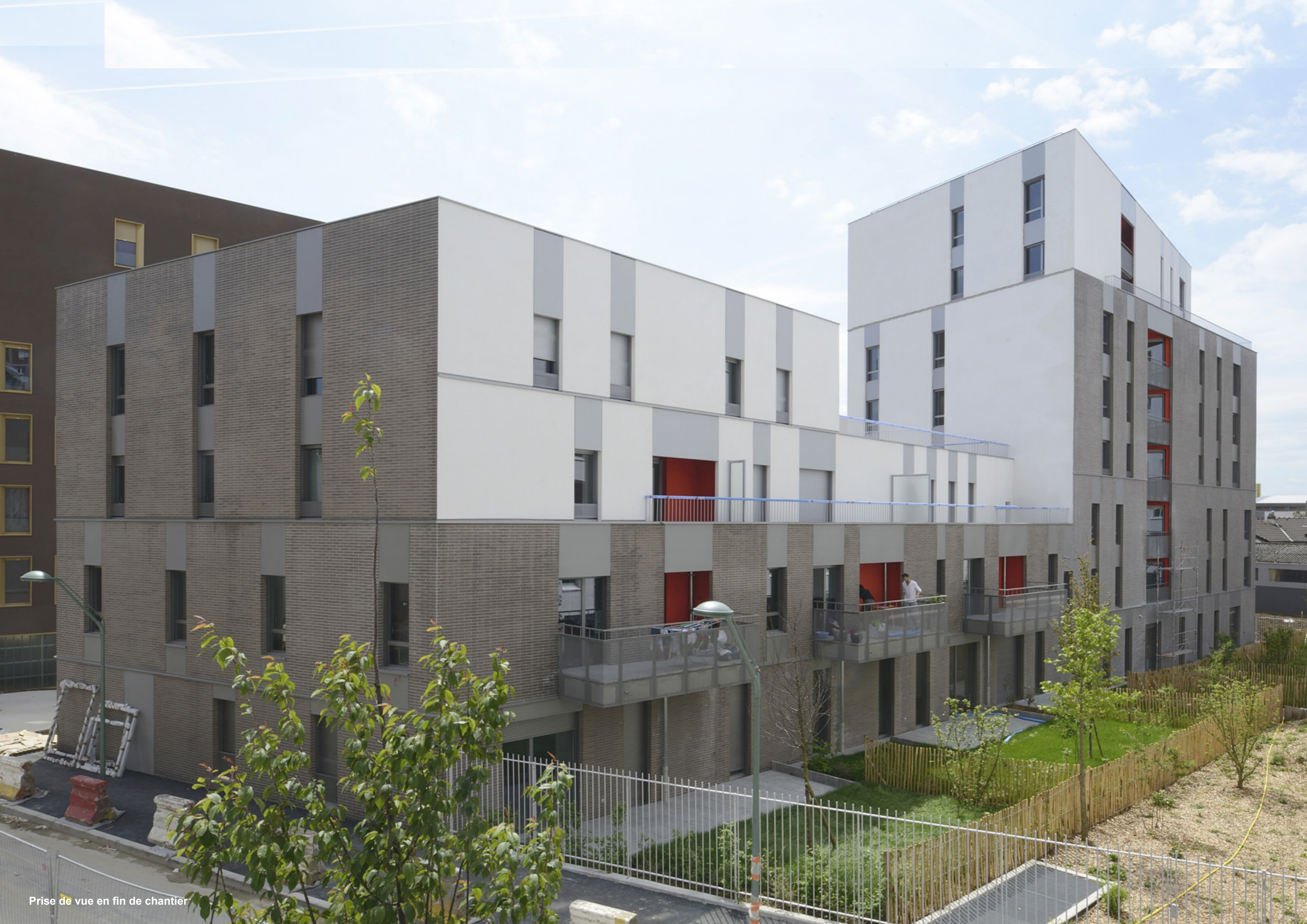
Prise de vue en fin de chantier