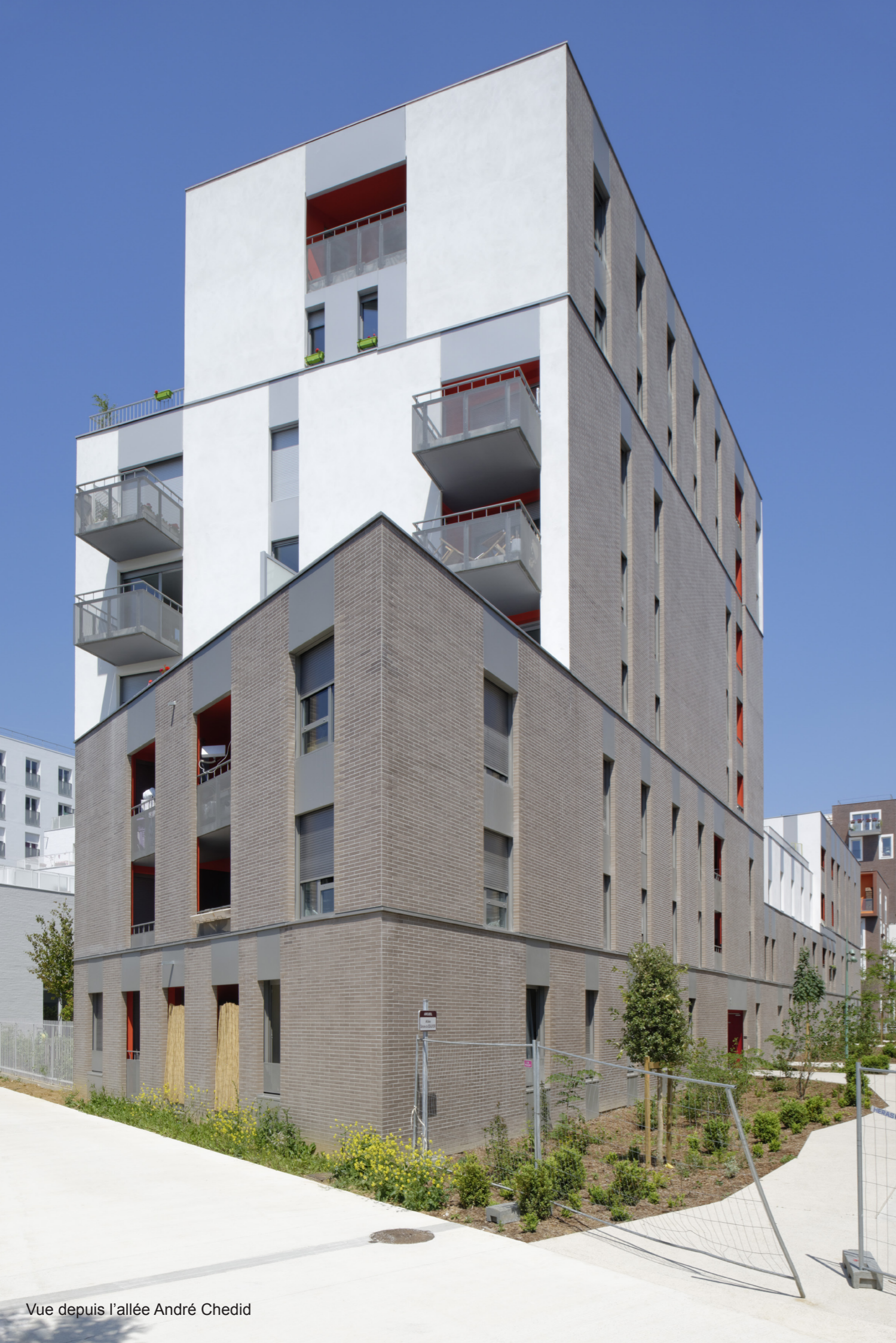
Vue depuis l'allée André Chedid