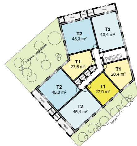
Plan d'étage courant - R+1 à R+3